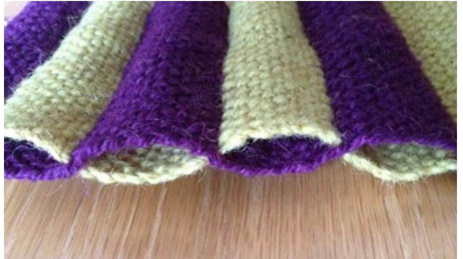
Cally Booker. Tejidos en doble tela.